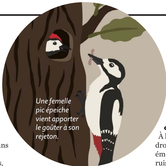
Une femelle pic épeiche vient apporter le goûter à son rejeton.

pue affalée sur le sol. «Je me sens tout de suite plus apaisée dans cet espace ouvert. Ici, on devrait voir des rapaces, comme le milan royal.»